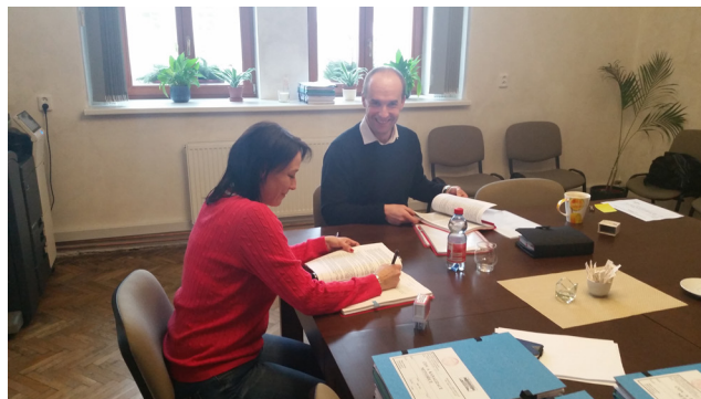
Podpis smlouvy se zhotovitelem projektu „Kanalizace a ČOV Netvořice“

Koncem srpna nebo na začátku září dojde k výměně oken. Pokud se nám podaří do podzimu vysoutěžít stavební firmu a počasí to dovolí, tak muzeum dostane do konce roku 2017 i „nový kabát“. Pokud ne, dojde k tomu až na jaře 2018.