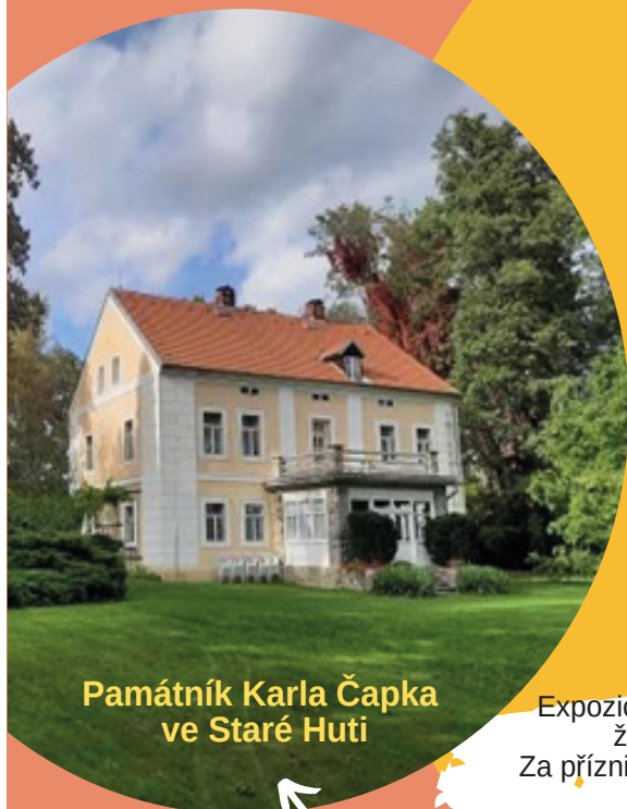
Památník Karla Čapka ve Staré Hutě

Městys Netvořice vás zve v sobotu 4.6.2022 na