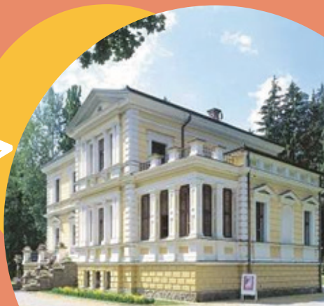
Památník Antonína Dvořáka ve Vysoké u Příbrami

tel: 317 789 203, 601 386 314 email: info@netvorice.cz osobně: Úřad městyse - v úředních dnech